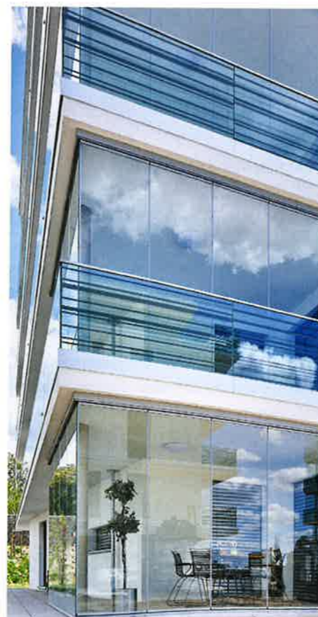
Umlaufende Balkone und Terrassen mit zu öffnenden Verglasungen von Lumon sowie eine hochwertige Ausstattung sorgen für ein besonderes Wohnambiente.

gen wurden drei unterschiedliche Varianten der Verglasung installiert. Die Garten- und Etagenwohnungen sowie die Penthäuser erforderten jeweils individuelle Lösungen. Nur so ließen sich die hohen Ansprüche aller Beteiligten an große und dennoch filigrane Verglasungen für alle Einheiten realisieren. „Die Dreh-/Schiebetechnik, die Lumon für seine Lösungen nutzt, gibt der Konstruktion etwas Schwebendes. Dadurch vermittelt die Vergla-