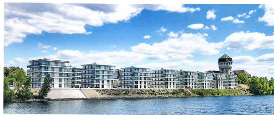
89 großzügig geschnittene, moderne Wohneinheiten unterschiedlicher Größe, mit sehr wohntonem Ambiente verteilen sich auf zehn Einzelgebäude direkt am Rheinufer.

finnischen Hersteller Lumon. Dafür gab es verschiedene Gründe, wie Bauträger und Architekt unisono bestätigen. „Die gestalterischen Elemente bei Lumon sind sehr elegant und geben uns bei der Planung viel Spielraum“, erklärt Architekt Löffler. „Die Lumon-Lösung arbeitet ohne große Profileinfassungen. Elegante Führungsschienen erlauben eine ansprechende Lösung für die Verglasung. Die Ausführung ist schön und schlicht.“ Auch in punkto Schallschutzanforderungen habe Lumon mit seinem Angebot überzeugen können. Für die Verglasung der 89 Wohnun-